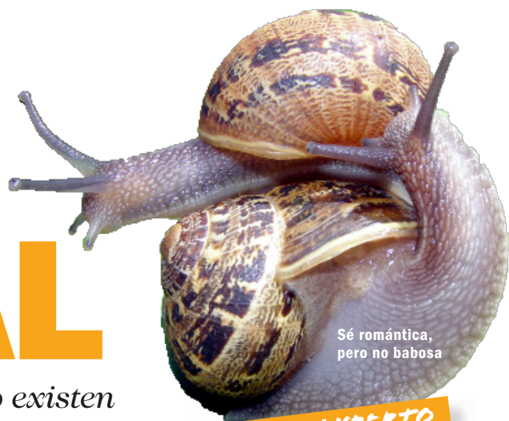
Sé romántica, pero no babosa

Si crees que en la fauna no existen armas de seducción... ¡error! Descubre la mejor táctica y saca tú también tus instintos primarios